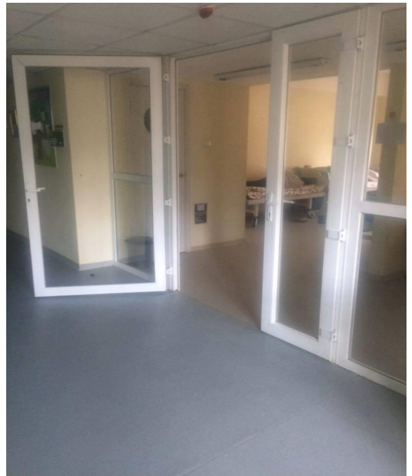
Зураг 7,8 Байгууллагын дотор өрөөнүүдийн хаалга,гарцуудыг чөлөөлж онгойлгов.