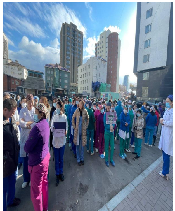
Зураг 5,6 Гурав дахь дохио дуугарахад та өөрийн байгууллагынхаа холбогдох албан тушаалтанд бүртгүүлж, гэр бүлийн гишүүд, анги хамт олны мэдээллийг үнэн зөв тодорхой өгч буй байдал