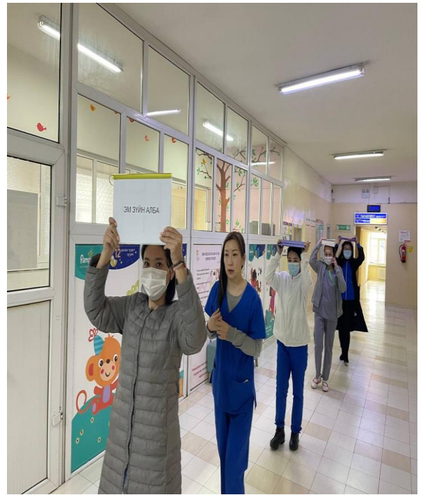
Зураг 3,4. Хоёр дахь дохио дуугарахад хамт олноороо байгаа бол толгойгоо халхлан яарч сандралгүй нэгийн цуваанд орж баруун гар талаа барьж, “гүйхгүй, эргэж буцахгүй, нэгнээ түлхэхгүй” гэсэн дүрмээ баримталж, байгаа газраасаа гарч, аюулгүй талбайд цугларна. Гарахдаа цахилгаан шат ашиглахгүйгээр гарч буй байдал